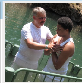
DOP I JORDAN